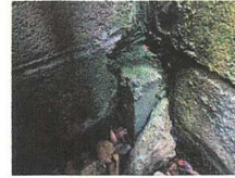
K65 : コンクリート杭