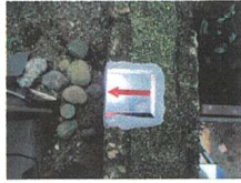
KP16 : プレート