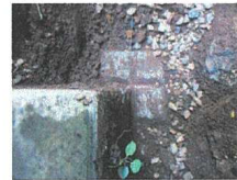
K28 : コンクリート杭