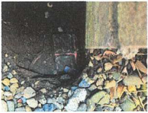
K63 : コンクリート杭