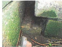
K65 : コンクリート杭